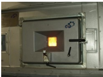
Porte foyère AET

devrait être la suivante : 78% en plaquettes forestières, 18% en bois de rebut et 4% en connexes de scieries. Cofely Services a élaboré le plan d'approvisionnement en partenariat avec le Syndicat de sylviculteurs des Pyrénées-Atlantiques et une vingtaine de PME locales, qui participeront à la collecte et à la préparation du bois-énergie. Cette nouvelle installation devrait entraîner la création d'une centaine d'emplois dans la filière bois locale.