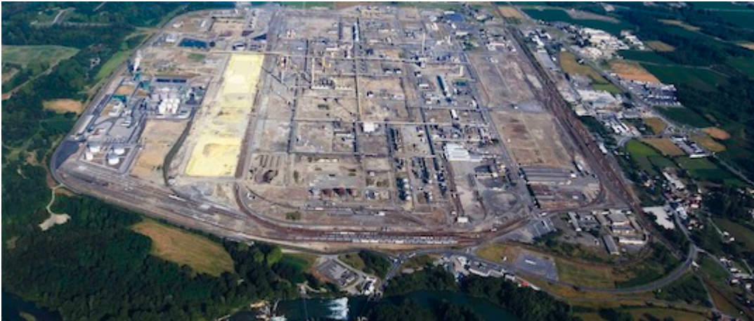
Le site Induslacq

Posté par Frédéric DOUARD le 25 juillet 2014